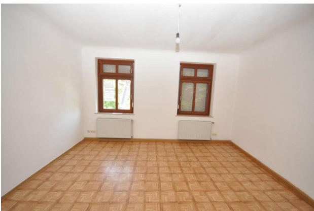
■ Beispiel Raum