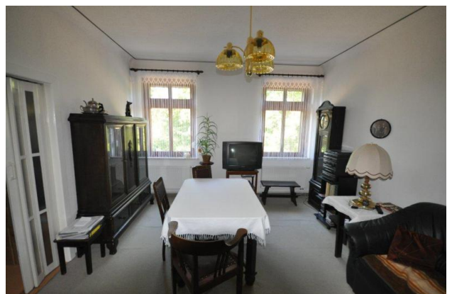
■ Beispiel Wohnzimmer