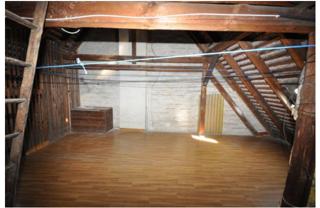
■ Ausbaufähiges Dachgeschoss