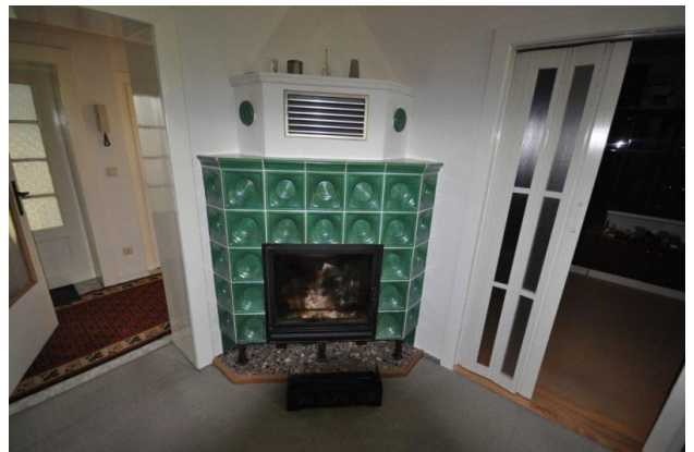
■ Wunderschöner alter Kachelofen