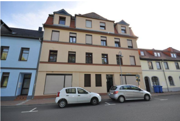
■ Mehrfamilienhaus mit Flair