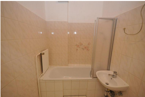
■ Beispiel Bad