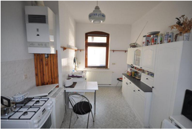
■ Beispiel Küche